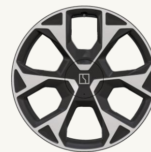
7X Flagship R21" Forjado, acabado bitono