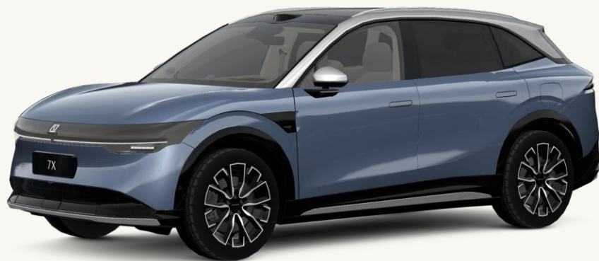
7X Azul Egeo/Techo Gris** ** No disponible en versión Sport