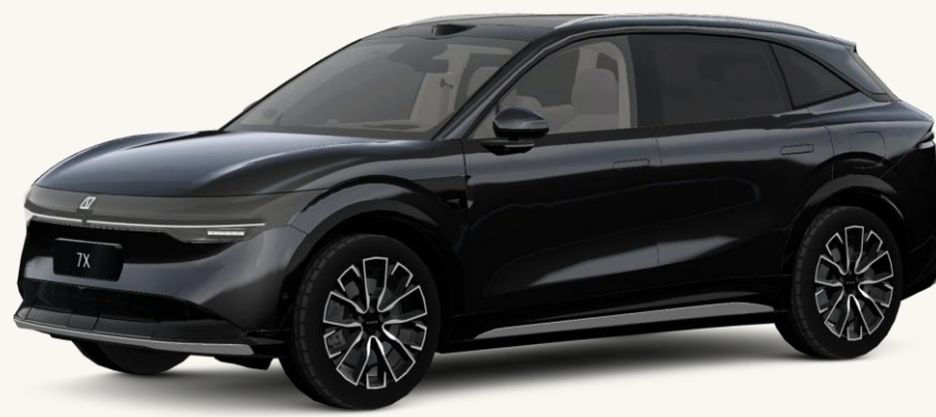
7X Negro Phantom