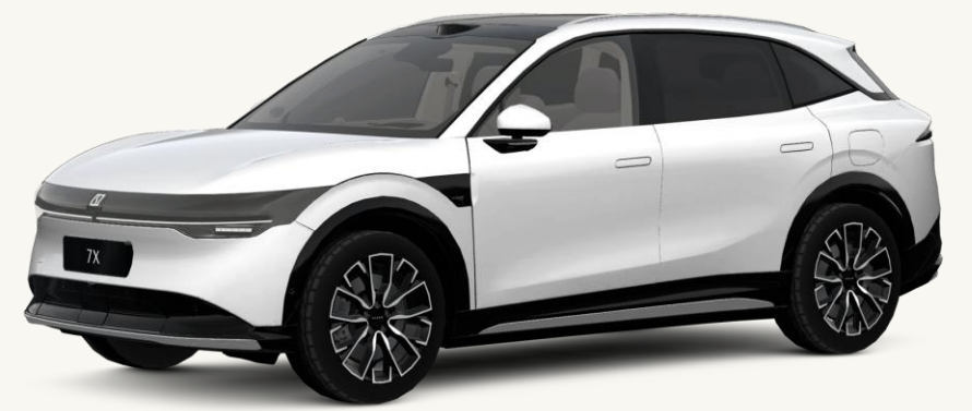
7X Blanco Cristal