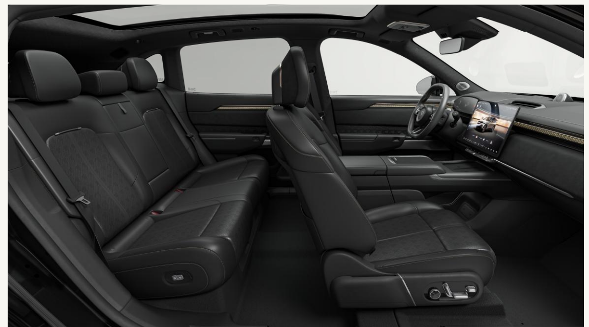
7X Premium, 7X Flagship Tapicería microperforada en cuero Nappa negro, de grano fino