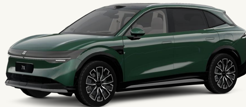
7X Verde Selva