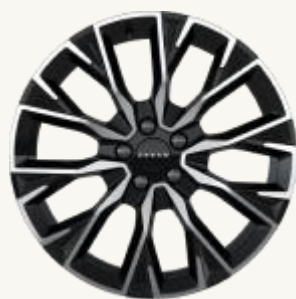
7X Sport, 7X Premium R19" Multi-radio, acabado bitono