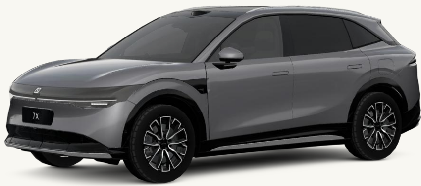
7X Gris Tecno