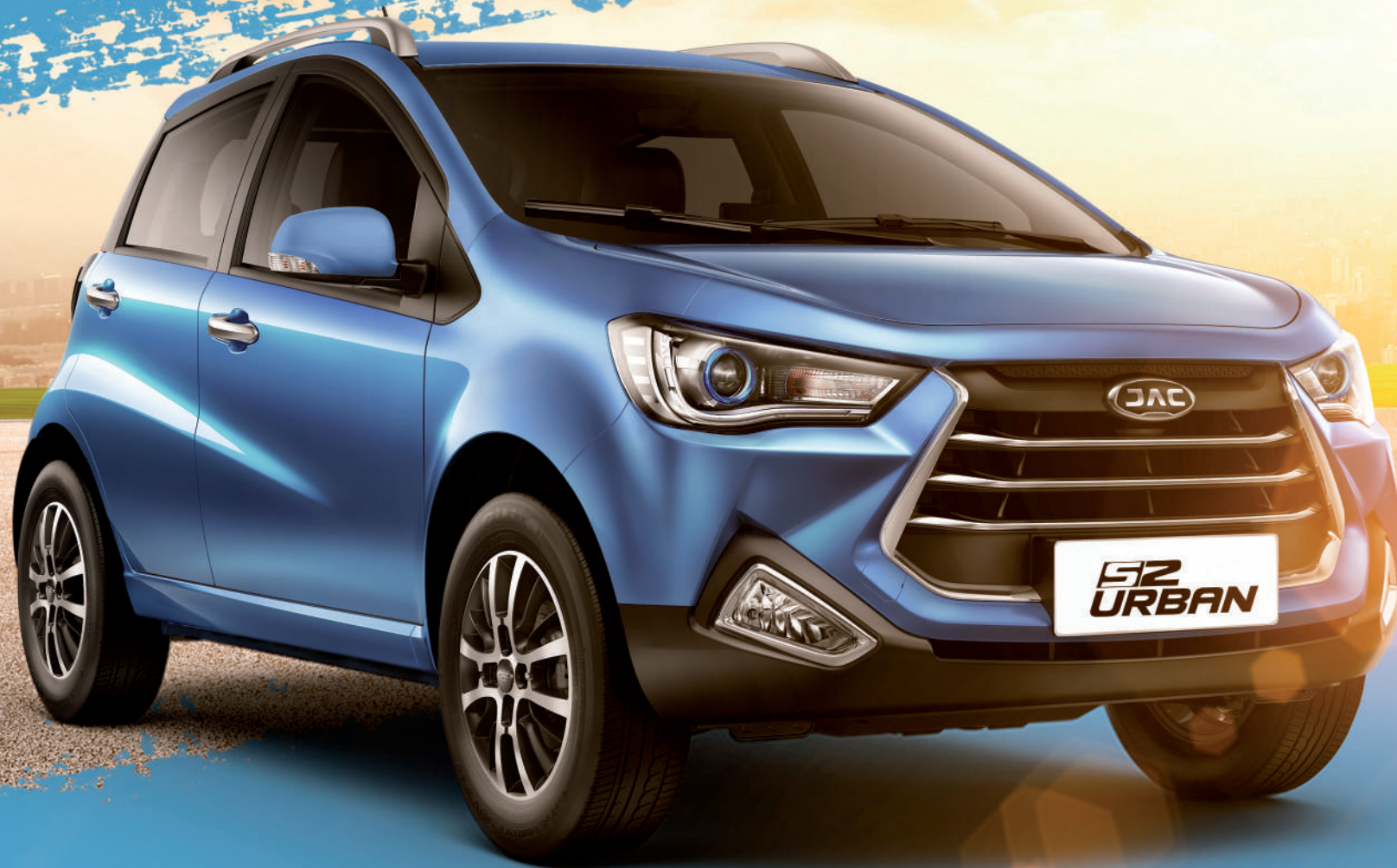
Imagen de referencia, algunas características técnicas y accesorios pueden cambiar sin previo aviso. www.jacmotors.com.co La referencia comercial S2 Urban Intelligent y S2 Urban Luxury corresponde a la referencia de fábrica S2 Mini.