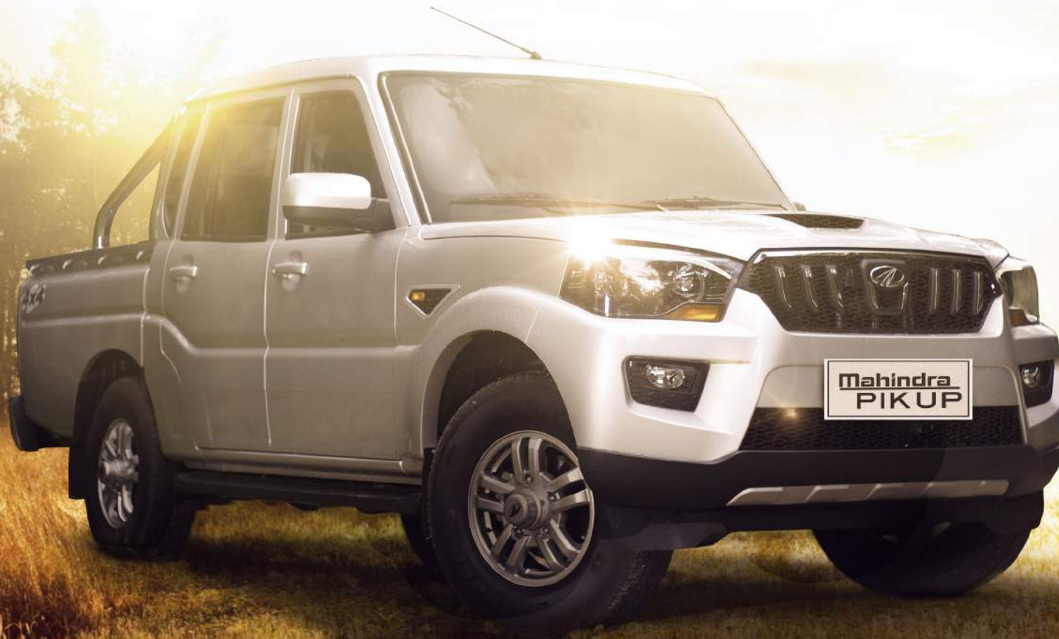
Imagen de referencia, algunas características técnicas y accesorios pueden cambiar sin previo aviso.